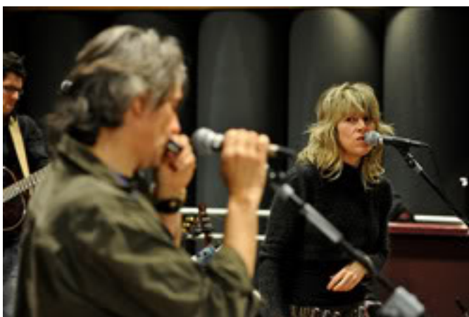
????? ?????? ?????????? ? ?????? ??????????:

????? ????????????? ??????? ??????? ?????????? ?????????????? ?????? – ????????????? ?????? ?????????? ?? ?????? ????????????? ?????? "D'instinct" (1995): ??? ???? ? ??????? ?????? ?? ??????? ?????? "L'envie d'y croire", "Lettre à Zlata", "Le blues d'la rue" ? "Rester debout" .