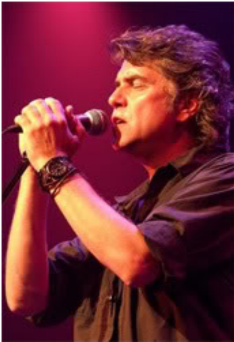
"Double vie" ??????? ?????? ????? ?????????? ??????????: ?? ?? ????????

????????? ?????????? Radio-Activité ? ????????? ?????? 50 ??????? ? ????? ??????? «????????» ?? ??????? ????????-??? 1986-?? ?????, ? ?? ?????? ??? ??? ?????? ??? ?????????? ??? «?????? ??????-?????????????».